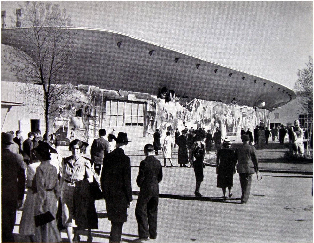
Der Pavillon „Die Schweiz, das Reiseland der Völker“. Die ganze Außenwand des Pavillons wurde vom Kunstmaler H. Erni als großes Gemälde verkleidet, das alle Arten des Tourismus und alles, was die Schweiz an Schönheiten des Landes und des Volkslebens dem Reisenden zu bieten hat, angedeutet.